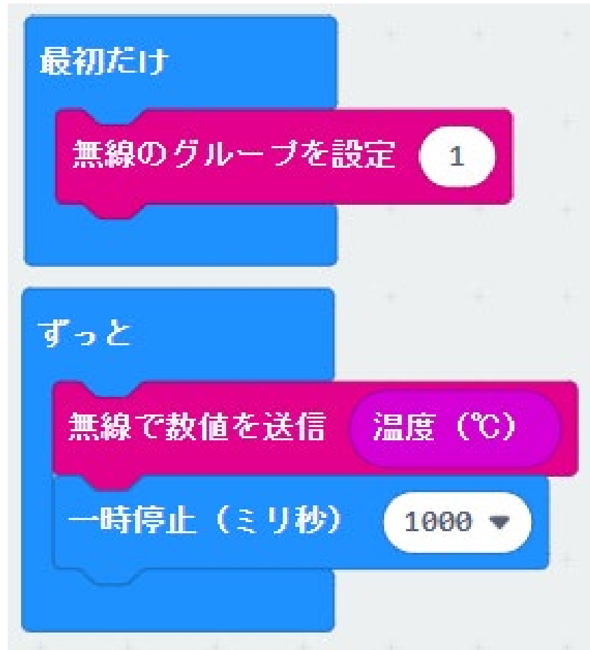
温度の測定側（送信側）