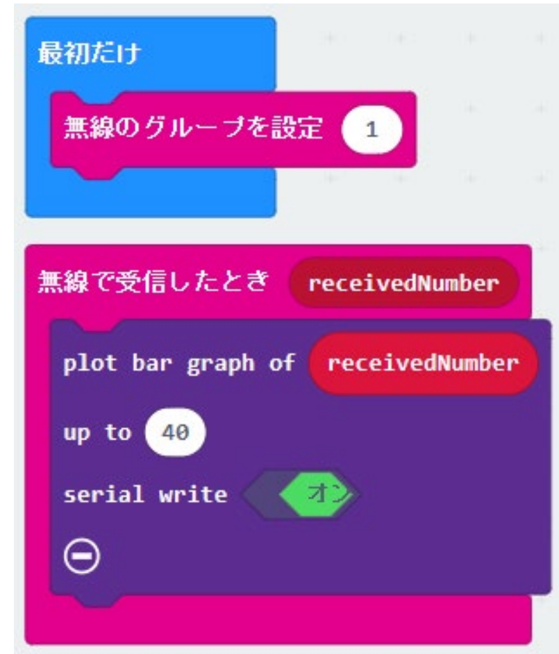
グラフの表示側（受信側）